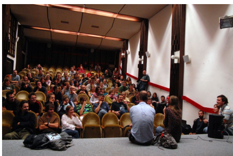
Diskusia s tvorcami filmu Ztracená dovolená .

dandygirl@gmail.com, 0905 199 428 občianske združenie štyri živly