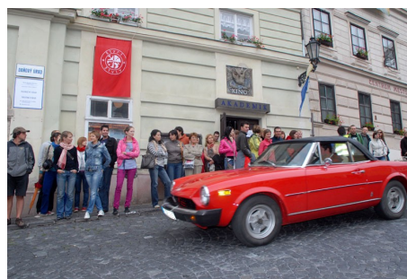
Diváci pred kinom Akademik.